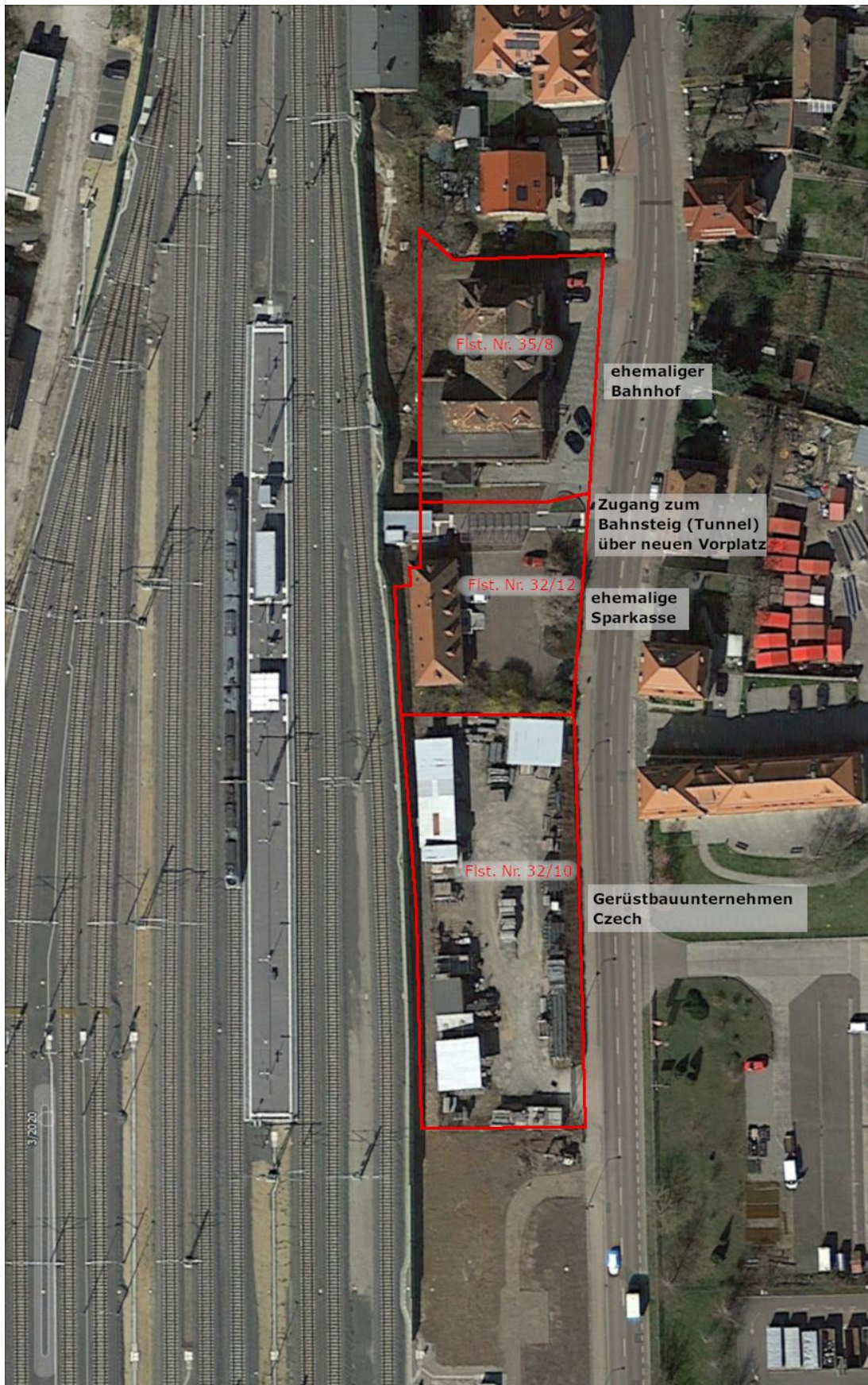
Abb.2: Luftbild Haltepunkt Gaschwitz